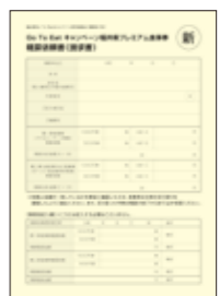
精算依頼書(請求書)